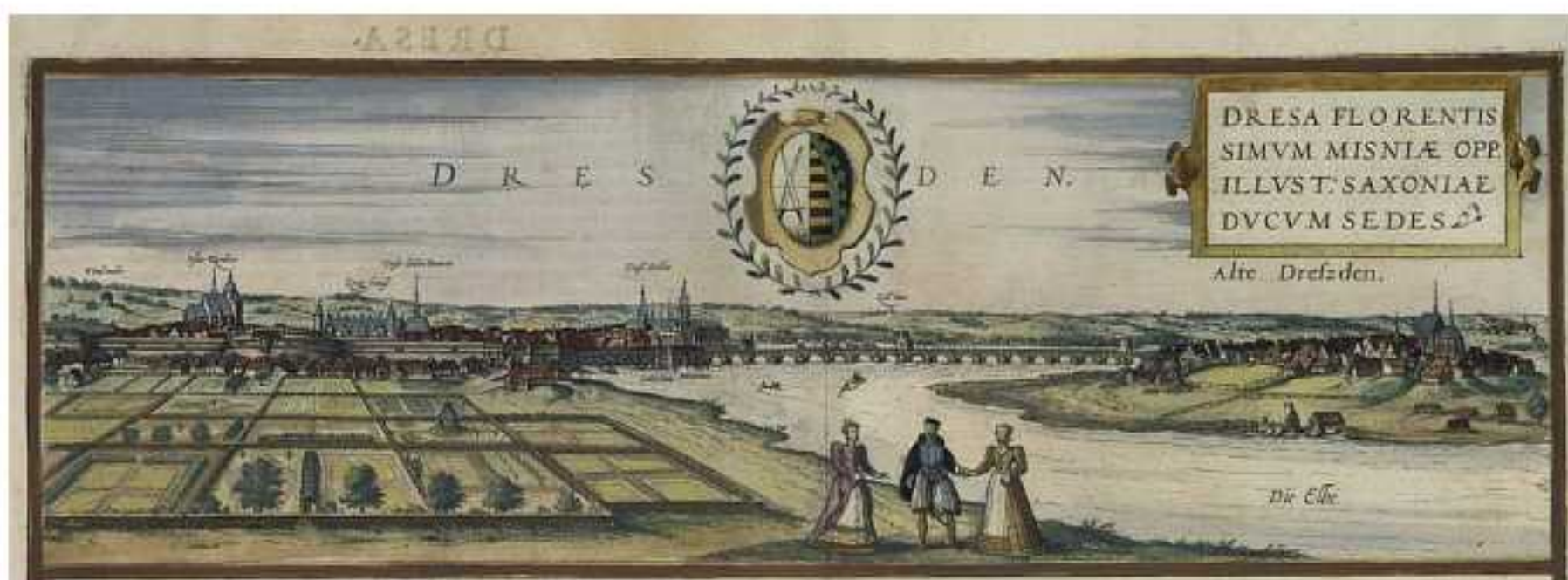
Dresden rond 1700