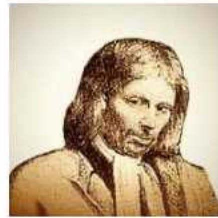
Jan Dismas Zelenka (1679-1745)