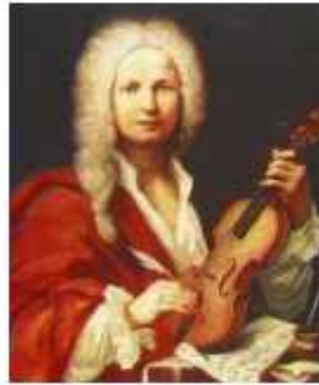
Antonio Vivaldi (1678-1741)