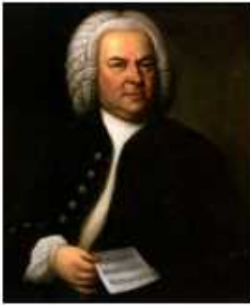
Johann Sebastian Bach (1685-1750)