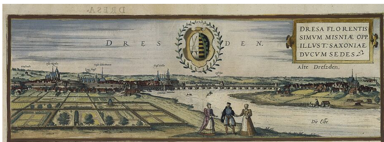
Dresden rond 1700