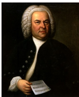
Johann Sebastian Bach (1685-1750)