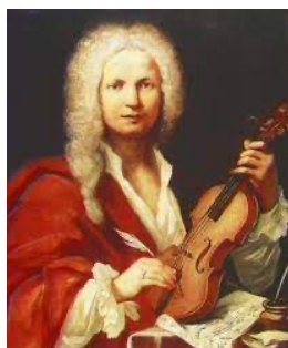
Antonio Vivaldi (1678-1741)