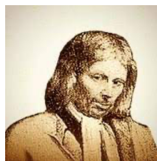
Jan Dismas Zelenka (1679-1745)